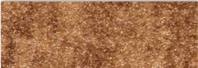
38 4m + 5m