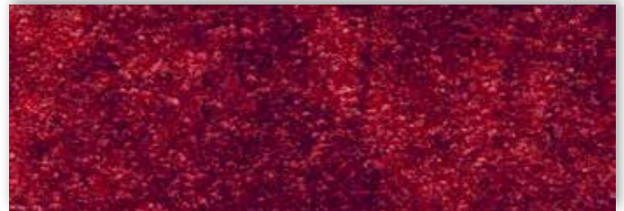
11 4m + 5m