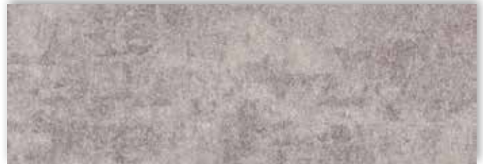
47 4m + 5m