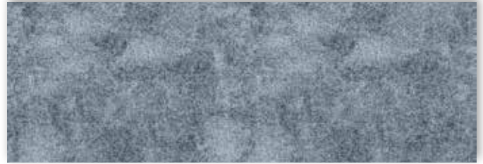
75 4m + 5m