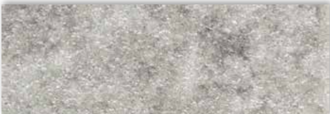
94 4m + 5m