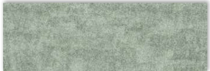
20 4m + 5m

La société Associated Weavers se réserve le droit de modifier les caractéristiques de ce produit tout en conservant les mêmes qualités techniques. Il est fortement conseillé d'utiliser les coloris moyens et foncés pour les pièces à grand trafic.