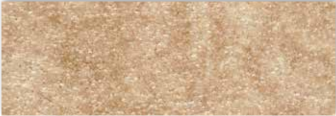
30 4m + 5m