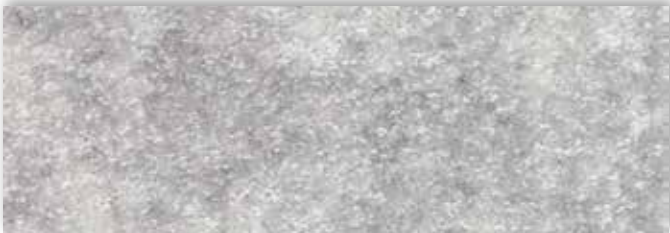
95 4m + 5m