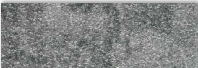
97 4m + 5m